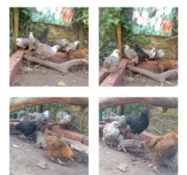
kuikens 11 weken

Orpingtons zijn redelijke tot goede leggers. De Buff Orpington staat bekend als bijzonder productief en legt gemiddeld 200 tot 280 grote, bruine eieren per jaar. Bij de meeste Orpingtons ligt het gemiddelde rond de 140–180 eieren per jaar.