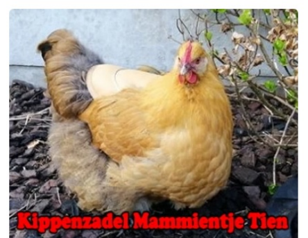
Kippenzadel Mammientje Tien

Worden de hennen toch wat kaal getreden, dan is het verstandig om hen een kippenzadel om te doen. Zo worden rug en veren beschermd en wordt verdere beschadiging effectief voorkomen.