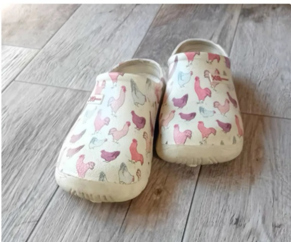
tuinklomp met kipjes, verkrijgbaar o.a bij tuincentra