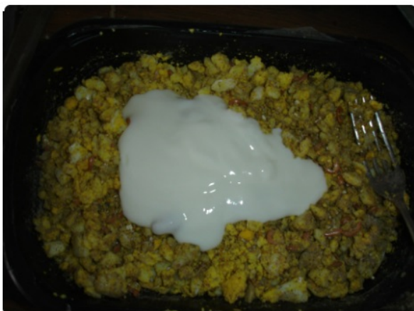
Karnemelk op een bedje van geprakt ei, garnaaltjes en wat scharrel/legmeel

Ook kan je de darmen van de kip "reinigen" met karnemelk. De werking van karnemelk komt voort uit het feit dat het een probioticum is. De melkzuurbacteriën in de karnemelk behoren tot de belangrijkste bacteriën van de darmflora.